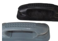
MANIJA MODELO NUEVO PVC N/G