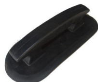
MANIJA MODELO VIEJO PVC N-G