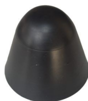
PUNTERA GOMA PVC NEGRA GRIS