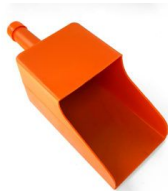
PALA DE ACHIQUE REGLAMENTARIA (GRANDE)