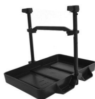
TAPA DE BATERÍA HASTA 75 C/TOR (CHICA)