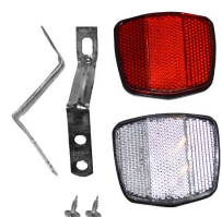
REFLECTOR PLAYEROS CON FLEJE DE CHAPA CRISTAL + ROJO