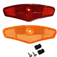
REFLECTOR RUEDA GRANDE AMBAR + ROJO CON KIT DE INSTALACION