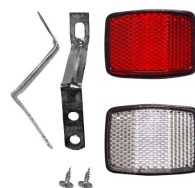
REFLECTOR TODO TERRENO CON FLEJE DE CHAPA CRISTAL + ROJO