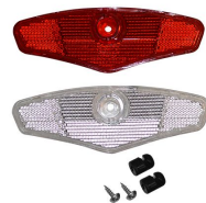
REFLECTOR RUEDA GRANDE CRISTAL + ROJO CON KIT DE INSTALACION