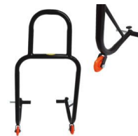
CABALLETE BANCO ELEVADOR TRASERO UNIVERSAL REGULABLE (NEGRO)