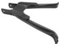
CABALLETE ZANELLA DUE / SOL / FIRE