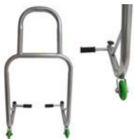
CABALLETE BANCO ELEVADOR TRASERO UNIVERSAL REGULABLE (GRIS)