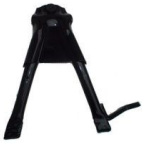
CABALLETE SMASH TUNING / OTRAS