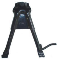
CABALLETE SMASH / BIZ Y OTRAS