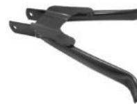
CABALLETE ZANELLA CARGA / V3-