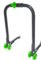
CABALLETE BANCO ELEVADOR PISTA UNIVERSAL REGULABLE