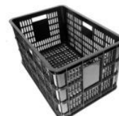
CANASTO PLÁSTICO MULTIUSO APILABLE REFORZADO CON VENTILACIÓN 57x38x30 (largo x alto x ancho) NEGRO (1110)