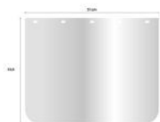
Repuesto Lamina Pet 200 micrones 23,5x31 para Mascara Facial Covid-19 (1116)