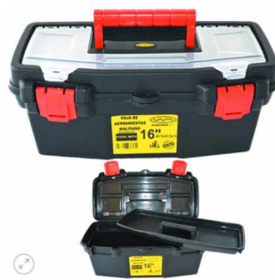
Caja de Herramientas / Multiuso 16" 40,5x20,5x18 color negro c/bandeja divisora y Tapa Organizadora Con Cerradura Plastica REFORZADA