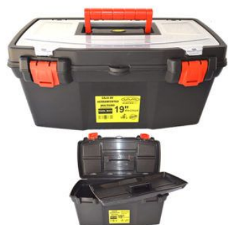
Caja de Herramientas / Multiuso 19" 48x23x24 color negro c/bandeja divisora y Tapa Organizadora Con Cerradura Plastica REFORZADA