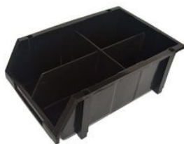
CAJON PLASTICO XL larg.520xanch.335xalt.190 mm P/ ARMAR ESTANTERIA color Negro (784)