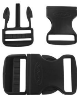
Hebilla Plástica P/mochilas Y Bolso 30mm