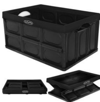
Cajon Plegable Multiuso 380x570x280 (60 Litros) Negro con borde Negro (1082)