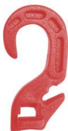
Gancho Broche Para tensor Elástico (ROJO) (1076R)