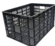
CANASTO PLASTICO MULTIUSO APILABLE REFORZADO CON VENTILACIÓN 48X34X26 NEGRO (1109)