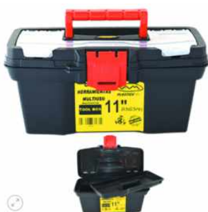
Caja de Herramientas / Multiuso 11" 29,5x23,5x14,5 color negro c/bandeja divisora y Tapa Organizadora Con Cerradura Plastica REFORZADA