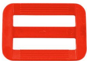
Hebilla Roja dado regulador pasante plástico para mochilas y bolsos Negra o Rojo