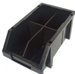
CAJON PLASTICO M larg.340xanch.200xalt.155 mm P/ ARMAR ESTANTERIA color Negro (785)