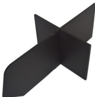
DIVISOR PARA CAJON PLASTICO M (JUEGO) (REPUESTO DE ART. 785)