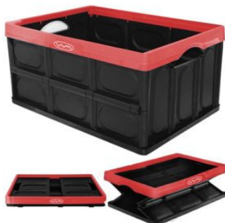
Cajón Plegable Multiuso 380x570x280 (60 Litros) Negro con borde Rojo (1082R)