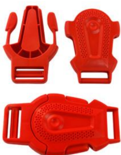
Hebillas Plásticas P/mochilas Y Bolso especial reforzada 5 cm Color ROJO (para cinta de 25mm)