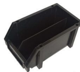
CAJON PLASTICO S larg.250xanch.145xalt.120 mm P/ ARMAR ESTANTERIA color Negro (786)