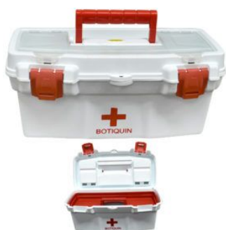
Caja de Primeros Auxilios / BOTIQUIN 16" 40,5x23,5x18 color BLANCA c/bandeja divisora y Tapa Organizadora Con Cerradura Plástica REFORZADA (1079)