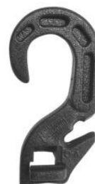
Gancho Broche Para tensor Elástico