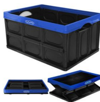
Cajon Plegable Multiuso 380x570x280 (60 Litros) Negro con borde Azul (1082A)