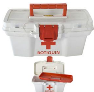
Caja de Primeros Auxilios / BOTIQUIN 11" 29,5x20,5x14,5 color BLANCA c/bandeja divisora y Tapa Organizadora Con Cerradura Plastica REFORZADA