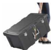
Baúl Multiuso (79,4 x 44,8 x 35,2) 125 Litros, con tapa, manija y ruedas (1120)