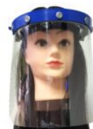
Máscara Facial Protector sanitario Covid-19 con vincha y arnés, Lámina de acrílico de 0,5mm (1115)