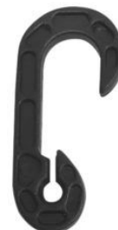
Gancho Broche Para Soga Elástica Pulpo (1077)