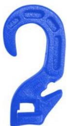
Gancho Broche Para tensor Elástico (AZUL) (1076A)