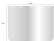
Repuesto Lamina, acrílico 0,5mm 23,5x31 para Mascara Facial Covid-19 (1117)