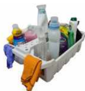
Bandeja Porta Elementos de Limpieza Multiuso color Blanca 49x35x18 (1121B)